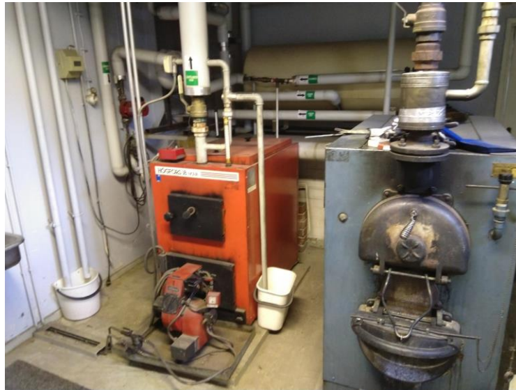
Oljy-/puukattila (entinen järjestelmä)