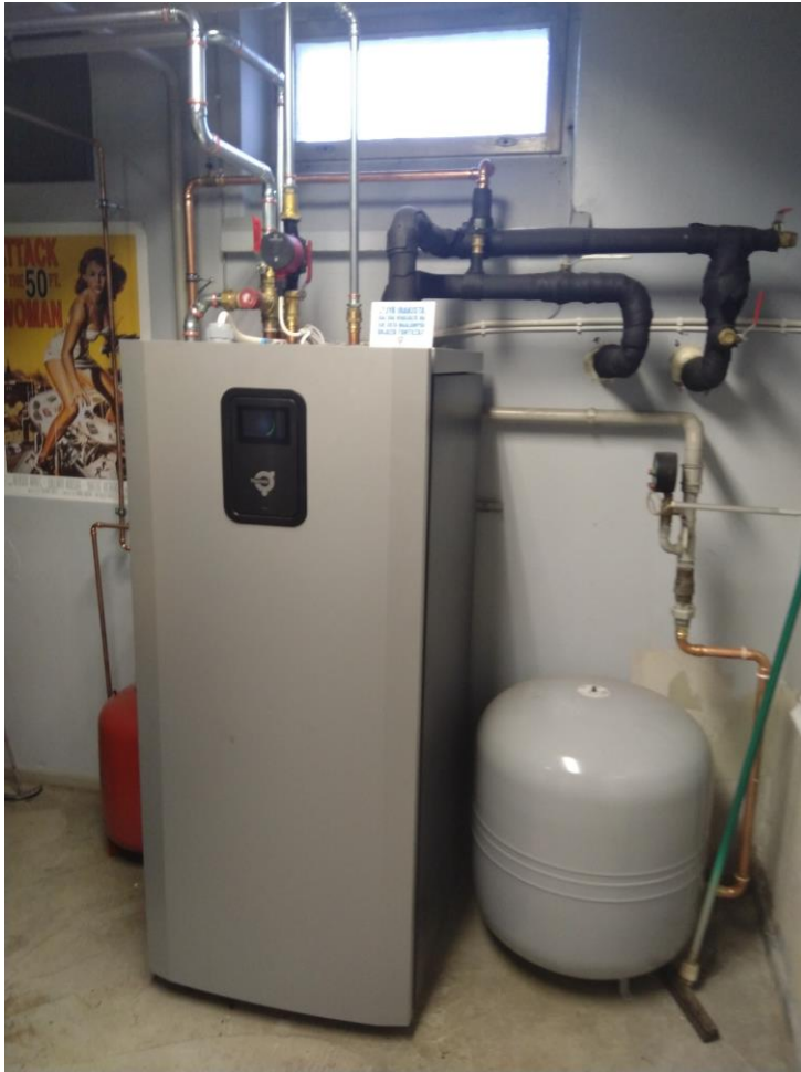
Maalämpöjärjestelmä 10 – 33kW, verkosto 2000m